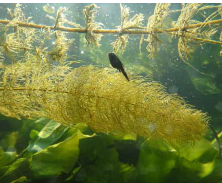
▶ | Андрей Явнашан — камера GoPro 3+